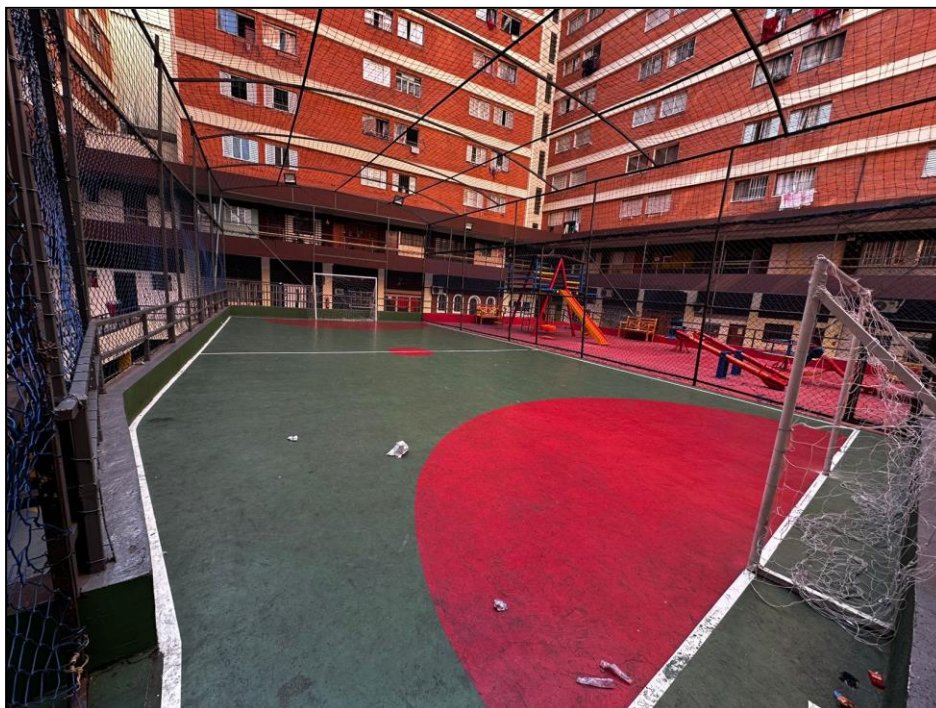
Quadra de Futsal