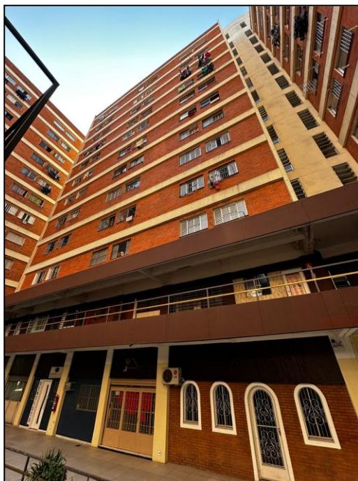
Vista panorâmica do Edifício Miriam