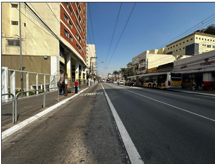
Vista da Avenida Celso Garcia que dá acesso ao Condomínio