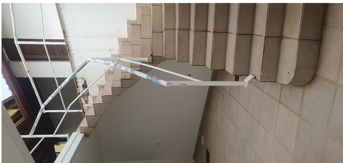
Escada de acesso ao primeiro piso