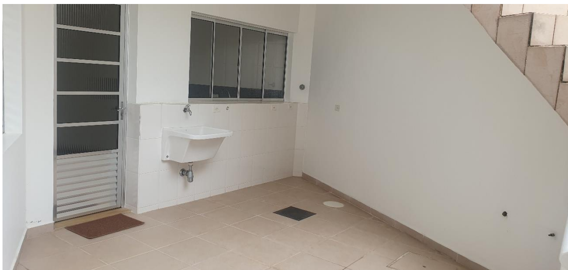
Lavadeira da casa de caseiro